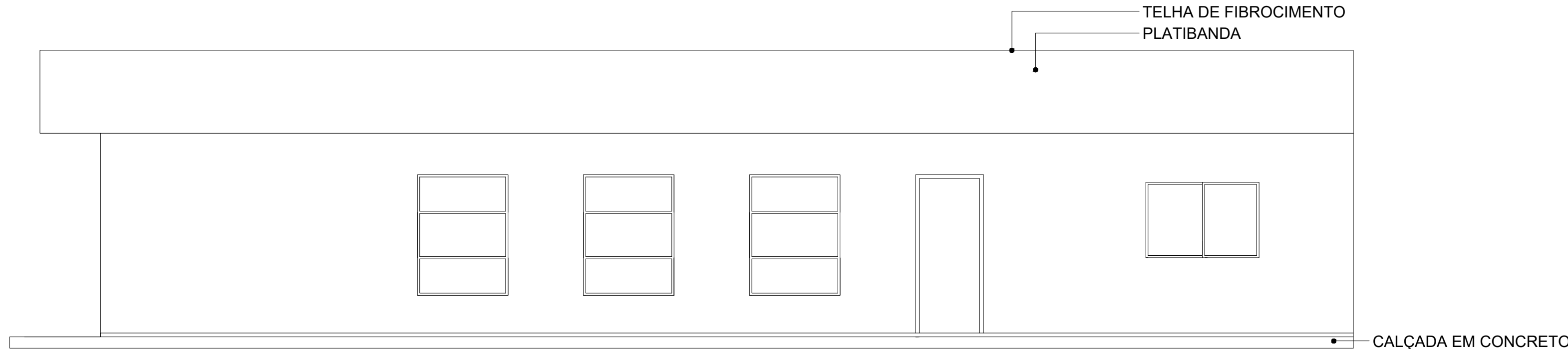
FACHADA LESTE ESCALA 1/50