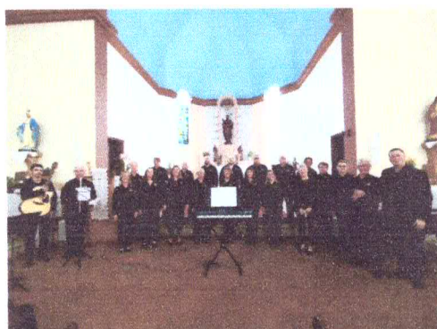
Encontro de Corais Daltro Filho 04/05/2025