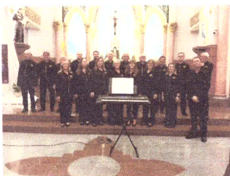
Encontro de Corais Guaporé 26/04/2025